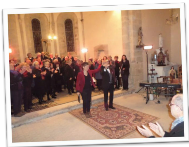
Les deux chorales qui se sont produites en l'église de Favars à fin 2017